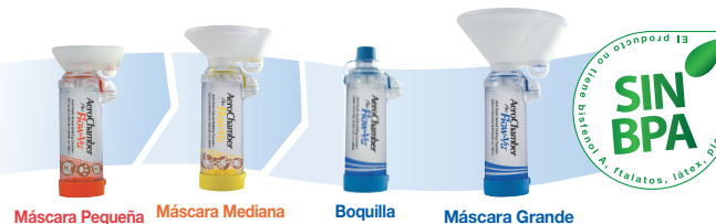
Máscara Pequeña Máscara Mediana Boquilla Máscara Grande